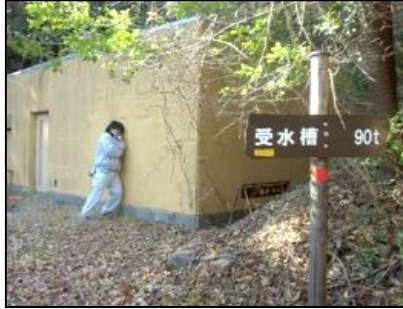
25 受水槽(90 t)