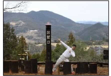
14 わんぱく山展望台